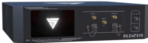
OFD-ALPHA (actuellement commercialisé)